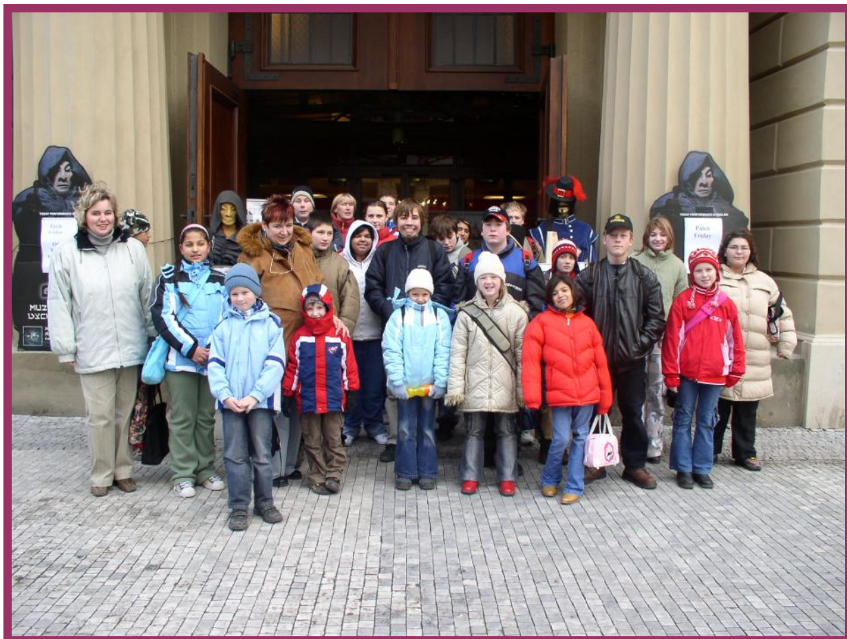
Společné foto před divadlem

Ve čtvrtek 13. prosince 2007 jsme navštívili představení „Sněhová královna“ v muzikálovém divadle Hybernia. Těšili jsme se na pohádku Hanse Christiana Andersena, který napsal kdysi o tom, jak se jednou zlí duchové tak dlouho prali o své kouzelné zrcadlo, až jim upadlo a rozbilo se na tisíce kousků. Střípky posbírala Sněhová královna a rozhazovala je při své jízdě na saních. Jestliže střípek padl někomu do srdce, ihned se půlka jeho srdíčka změnila v kus ledu. Takovému člověku se najednou zdálo všechno ošklivé a přestal mít rád lidi. Odešel do říše Sněhové královny a už mu nebylo pomoci... Opravdu ne? A přece je na světě moc, která dovede všechno překonat. Je to lidská láska.