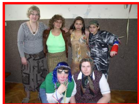
Dolidu a její tým