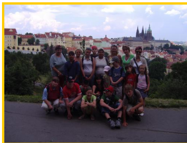
Foto s výhledem na Hradčany

Byla sobota 7. června 2008 a opět jsme se ráno sešli v Roudnici nad Labem na nádraží s naším vlastivědným kroužkem. Cílem bylo naše hlavní město. Z nádraží jsme vyrazili přes Staroměstské náměstí, Karlův most a Kampu na stanici lanovky. Ta nás vyvezla na Petřín přímo do „Růžového sadu“, kde jsme posvačili. Potom následovalo zrcadlové bludiště a Petřínská věž. Počasí nám přálo a výhled stál za to! Prahu shora jsme viděli i z cesty okolo Strahovského kláštera. Přidali jsme do kroku, abychom stihli zvonky na Loretě, Pražský hrad a potom rychle na vlak k domovu. Nelitujeme sobot, které prožíváme se školním kolektivem, protože vidíme krásu, na kterou dlouho vzpomínáme.