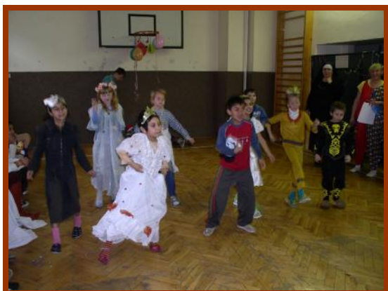
Když se tahá za šňůru, skáče masky nahoru