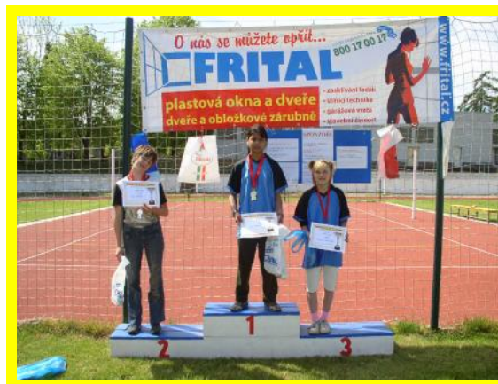
Litoměřice Roudnice Roudnice Stupně vítězů - skok daleký