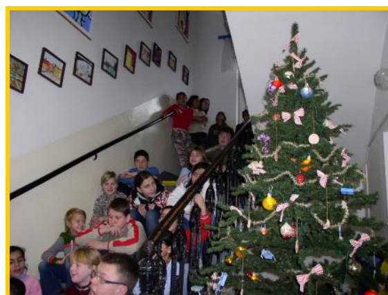
Vánoce, Vánoce přicházejí, zpívejme přátelé