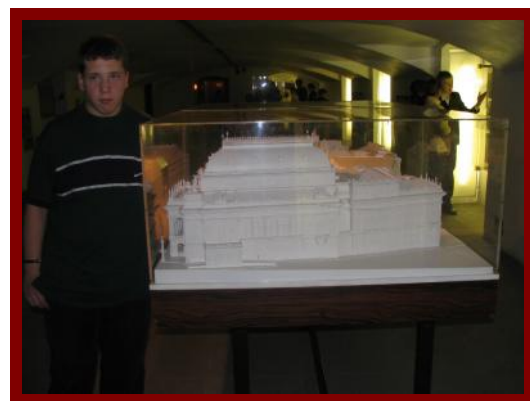
Národní divadlo jsme si důkladně prohlédli.