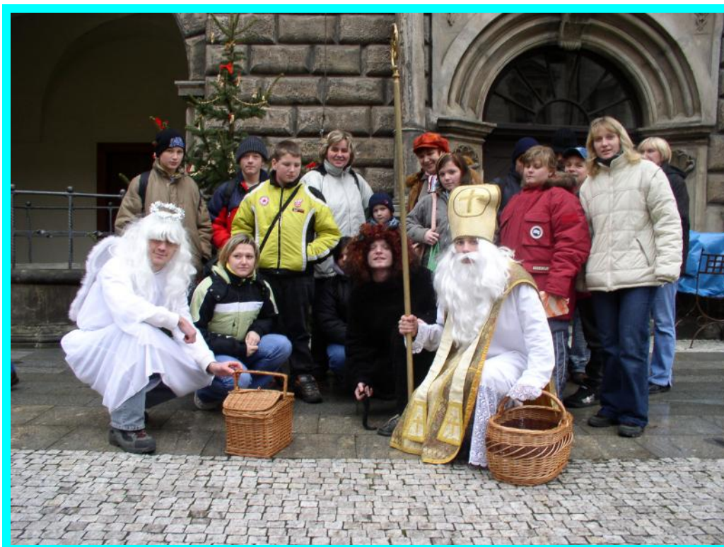
S čerty nejsou žerty...