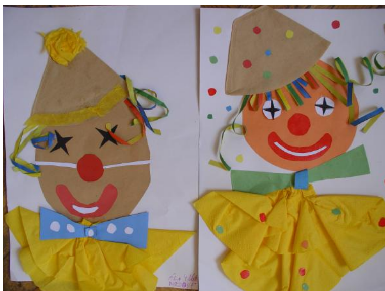
Práce mladších žáků

Krásné masky, hudba, tanec, hry a spousta legrace. Tak to byl náš Maškarní ples.