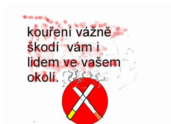
vytvořil žák 9. ročníku