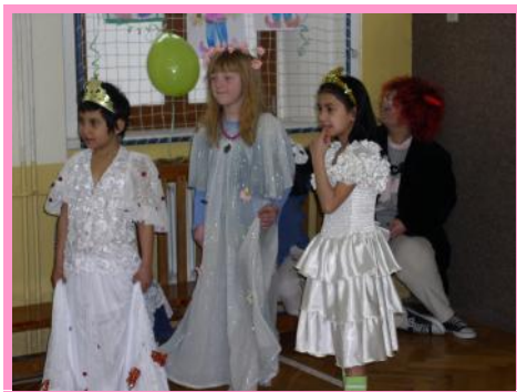
Princezničky na bále....