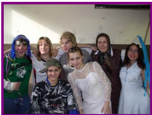
Koukejte, jak nám to sluší!