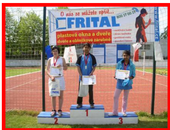
Úštěk Roudnice Roudnice Stupně vítězů - běh na 800 m