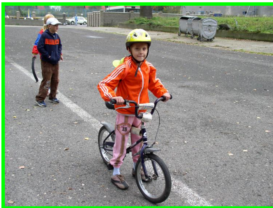
1. sportovní akce prvňáčků