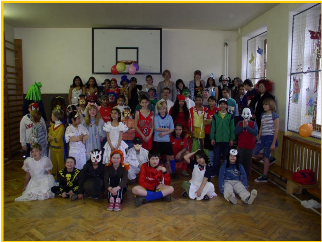
Společné foto masek