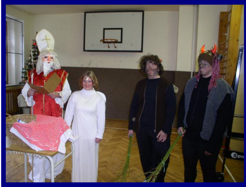
Mikuláš, anděl a čerti

V maskách čertů a anděla se zapojili do programu žáci 9. třídy. Při tradičním rituálu rozdali dětem pochvaly a drobné dárky. Loučili se slovy: „Na shledanou při příštím podobném setkání.“