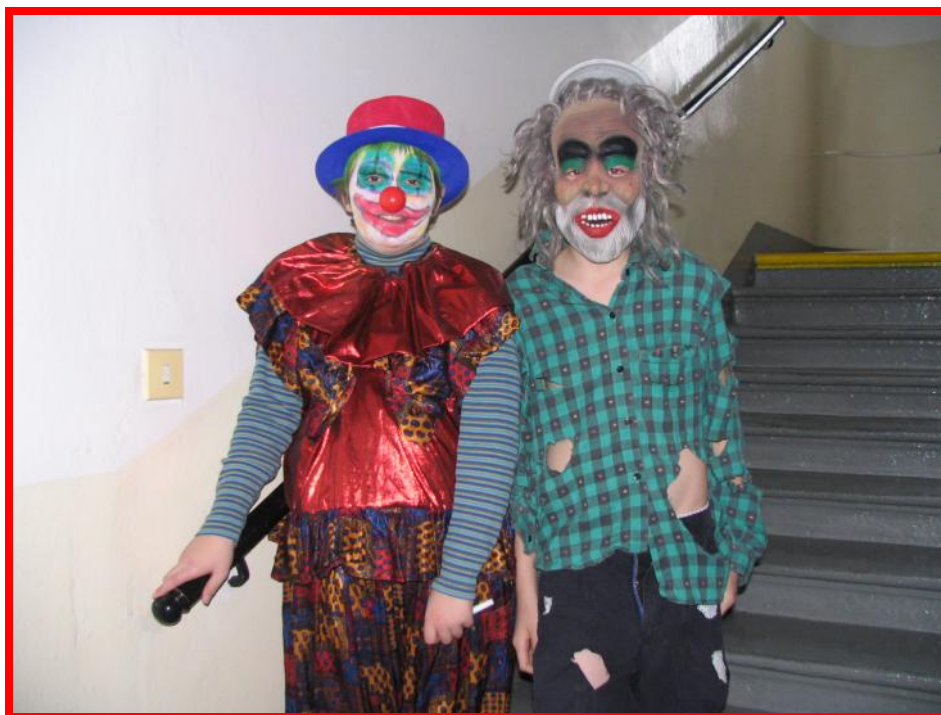
Jak jinak, než s úsměvem!