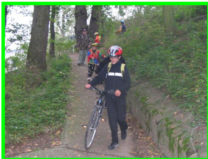
Cesta na závody