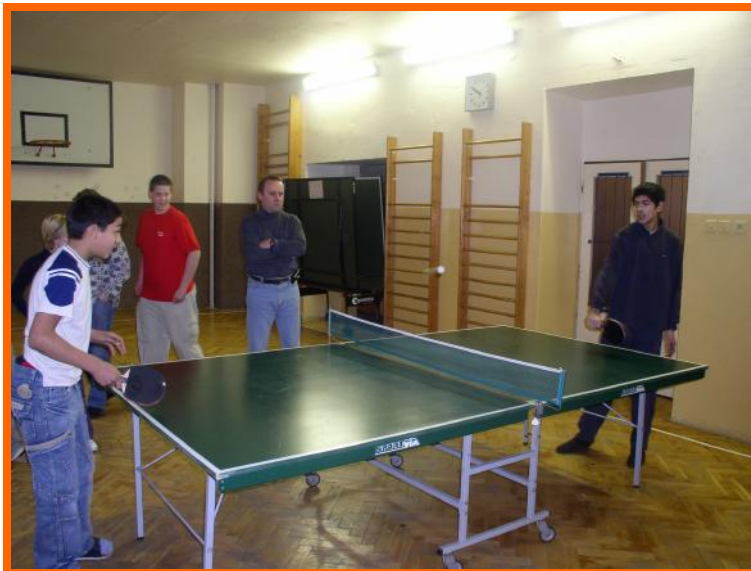
Kdo bude vítěz utkání?

Pro žáky byla tato soutěž smysluplným naplněním velkých přestávek.