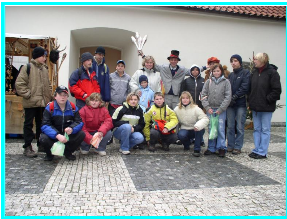
„Šašek nás vždy pobaví“

Celou cestu domů si děti sdělovaly ve vlaku dojmy z právě prožitých událostí. Děti byly unavené, trochu zmoklé, ale spokojené. Advent na zámku byl klidný, příjemný a na trhy v Praze jsme se podívali 8. prosince cestou do Národního divadla a také 13. prosince, když jsme navštívili divadlo Hybernia – představení Sněhová královna.