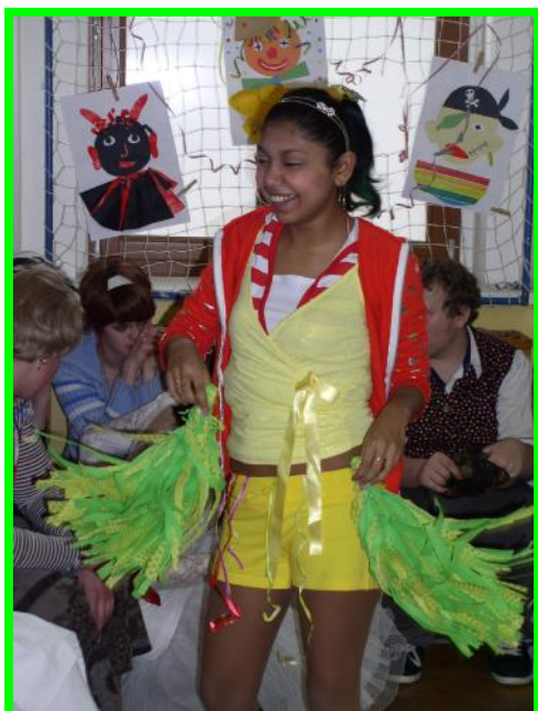
Roztleskávačka v akci