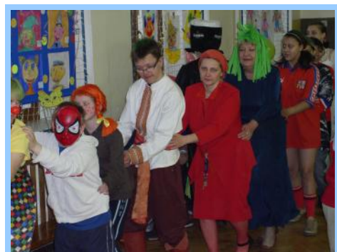
Jede, jede, mašinka...