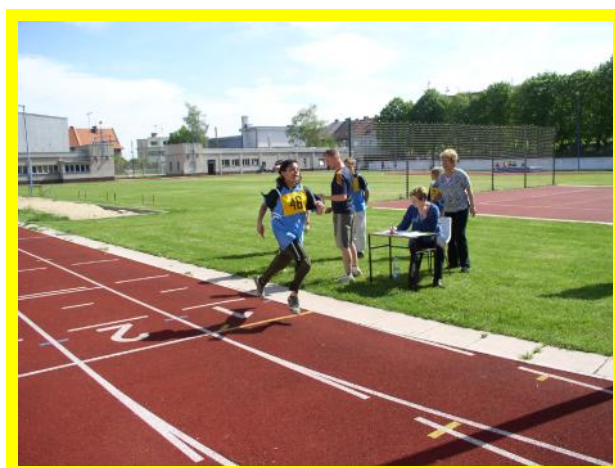
Vítězka běhu na 800 m (Roudnice)