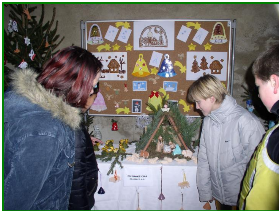
Vánoce jsou za dveřmi...

V prosinci 2007 jsme se zúčastnili vánoční výstavy, která probíhala v ambitech augustiniánského kláštera při kostele Narození Panny Marie.