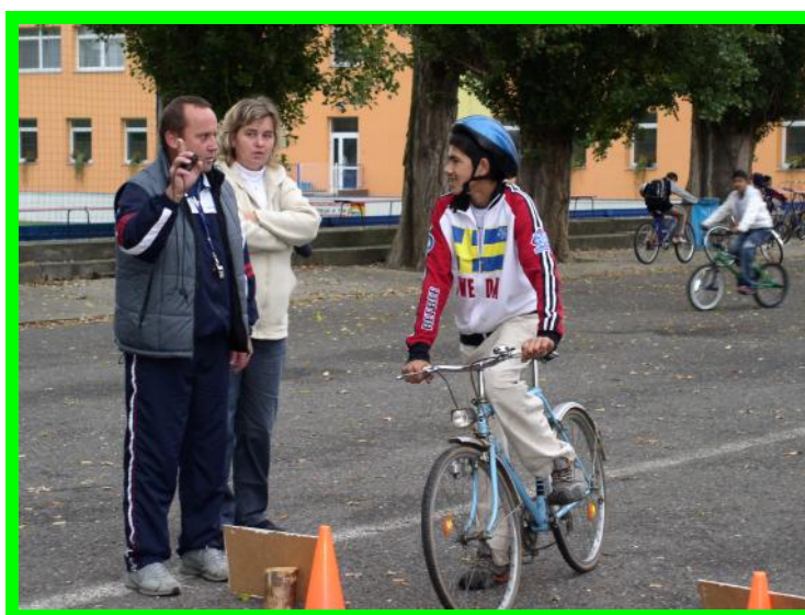
Poslední instrukce před startem