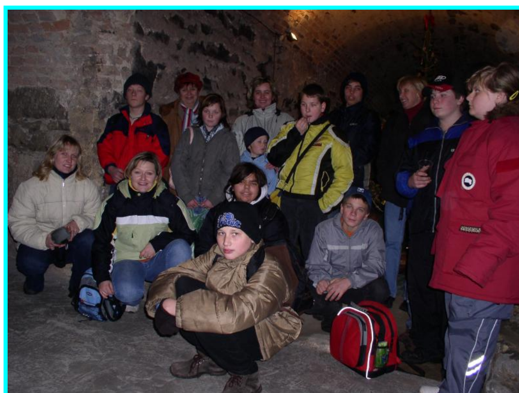
V zámeckém sklepení