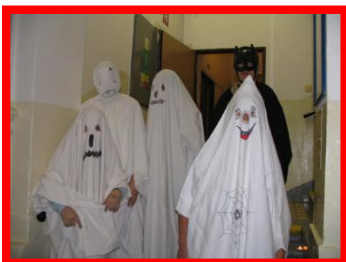
Duchové naší školy