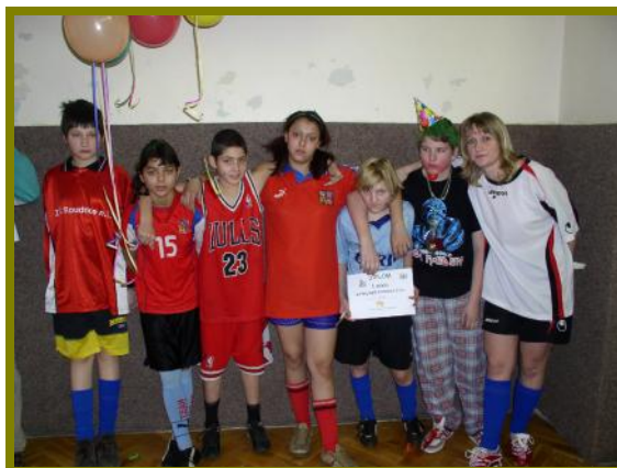
Vítězové kategorie: „ Literární dílo“