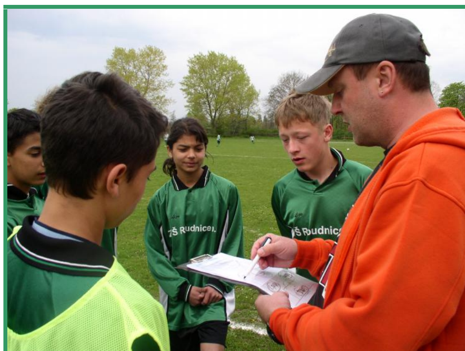
Cenné rady před zápasem