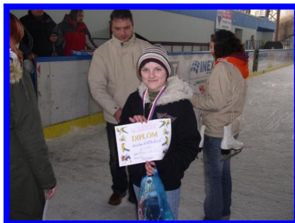
2. místo - stříbrná medaile