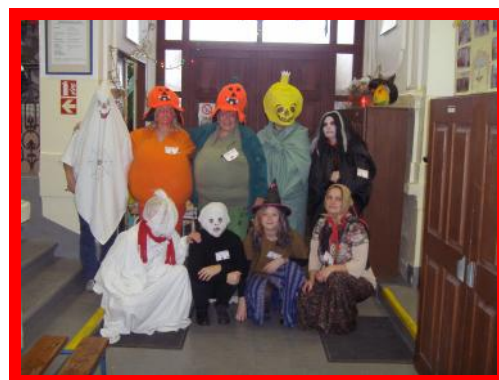
Strašidelný učitelský sbor