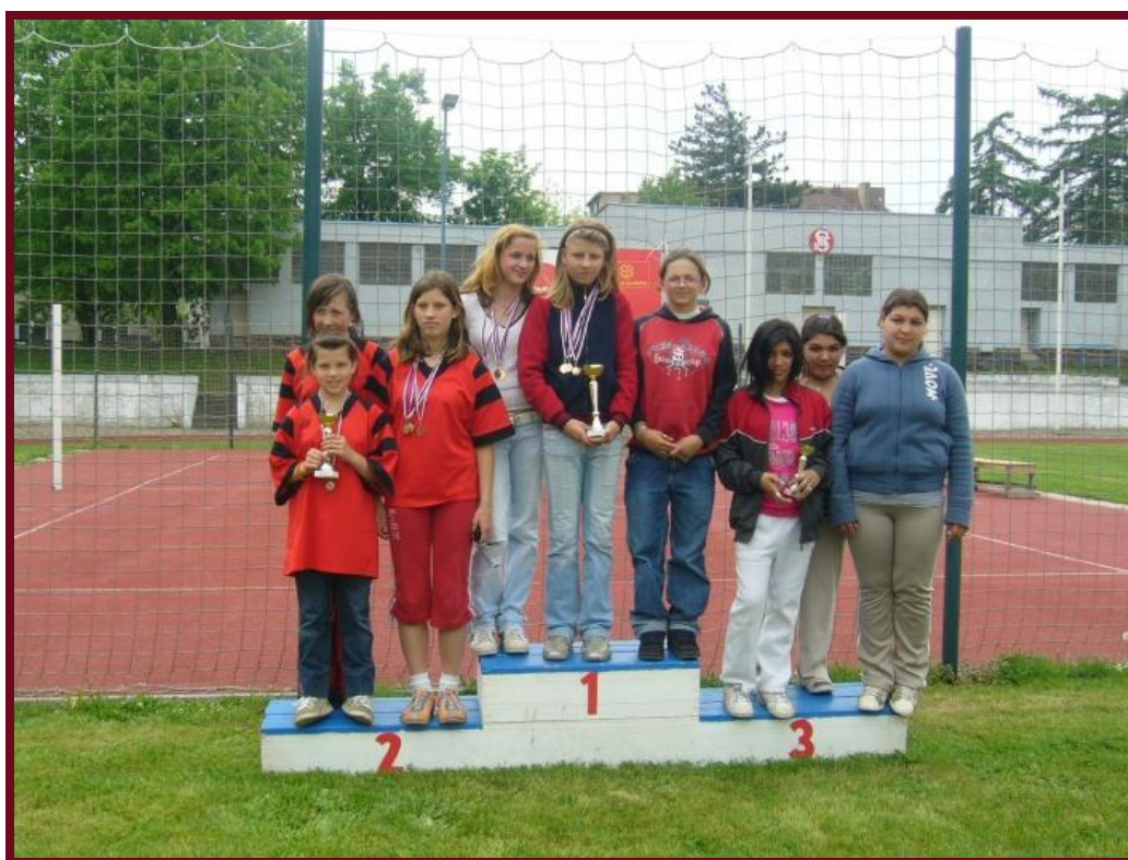
Naše děvčata obsadila 3. místo.

Skok daleký, hod kriketovým míčkem, běh na 60 m, 800m a 1500m – to byly disciplíny, ve kterých soutěžili žáci a žákyně speciálních škol z Dlažkovic, Lovosic, Litoměřic, Libochovic, Úštěku a Roudnice nad Labem. Sportovní dopoledne se konalo 11. května 2010 na roudnickém Tyršově stadionu. Účastníci závodu podávali co nejlepší sportovní výkony. Nejúspěšnější byli mladí sportovci z Lovosic, kteří obsazovali první místa většinou ve všech disciplínách. V domácím družstvu byly úspěšnější dívky než chlapci. Dívkám se podařilo získat 3. místo v celkovém pořadí zúčastněných škol. Celé dopoledne se vydařilo. Sportovci byli v dobré náladě, vzájemně se povzbuzovali a soutěžili v duchu fair play – slušně a ukázněně. Velké poděkování patří ředitelům - rozhodčím a trenérům jednotlivých škol, kteří se podíleli na hladkém průběhu celého dopoledne, sponzorům, kteří věnovali do soutěže drobné upomínkové předměty a DDM Rozmarýn Litoměřice za finanční a materiální spoluúčast.